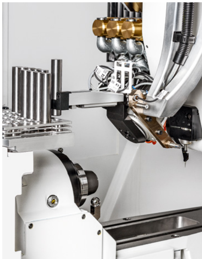
Option : Chargeur top