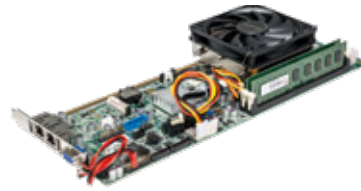
Port CPU Intel® Core™ i5/4 GO